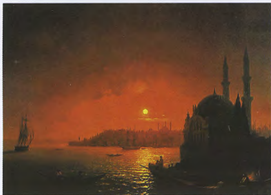
И. Айвазовский. Константинополь при луне

Интересное применение имеют в Турции еще и лепестки роз, особенно же розовых. В них обертывают или, лучше сказать, ими осыпают в сералях новорожденных, и только за неимением их употребляют для этой цели напоминающий их своим цветом розово-красный газ, который вследствие этого, как известно, ежегодно выписывается в Турцию и Египет целыми тысячами аршин.