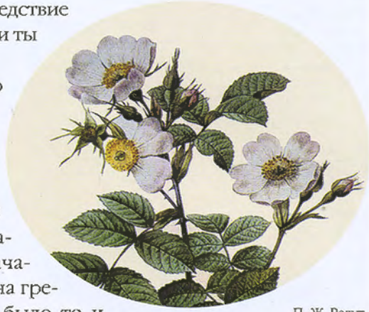
П.-Ж. Редут. Шиповник

Элиан приводит даже такой случай: у знаменитой куртизанки и первой красавицы во всей Греции Аспазии в детстве был на щеке нарост, от которого она никак не могла избавиться, несмотря на все старания знаменитейших того времени врачей. Сильно обезображивавший лицо, нарост этот приводил ее в такое отчаяние, что, сделавшись молодой девушкой, она решила даже лучше умереть. Но спасло ее сновидение. Ей приснилось, будто любимая птица Венеры — голубь явился ей в виде молодой девушки и предложил ей снять увядшие на челе богини розы и, сделав из их листьев род мази, натереть ею нарост. Аспазия сделала, как ей было сказано, нарост исчез, и она превратилась в красивейшую из женщин Греции.