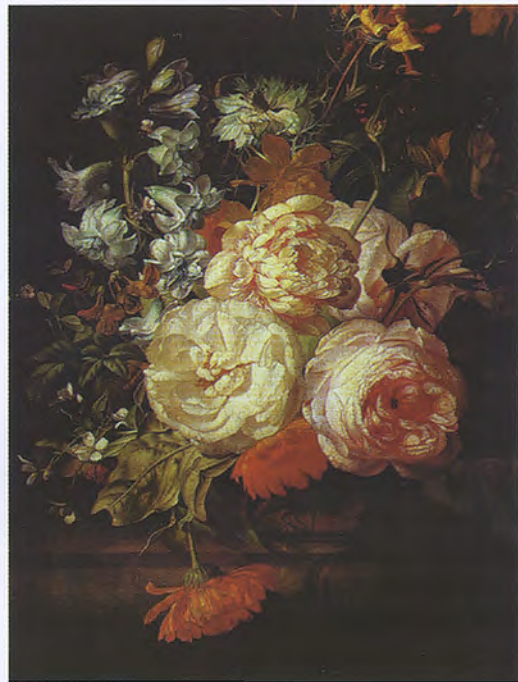
Р. Рюйш. Цветы в терракотовой вазе (фрагмент)