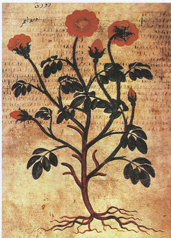
Садовая роза. Книжная миниатюра

От персов любовь и благоговение к розе перешли и к туркам или, лучше сказать, ко всем магометанам, которые согласно Корану верят, что белая роза* выросла из капель пота Магомета при